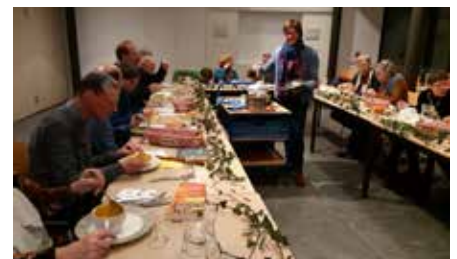
Soberheidsmaaltijd in de veertigdagentijd