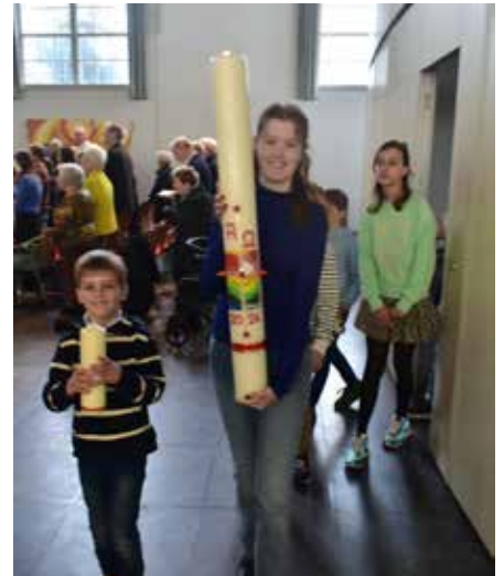
Binnendragen nieuwe paaskaars

Vredebergkerk 10.00 uur* ds. I.M. Pluim, overstapdienst